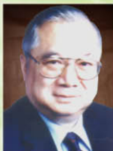
胡應湘爵士, GBS, KCMG