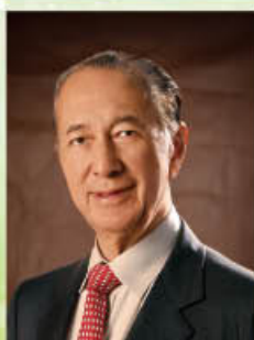
何鴻榮博士, GBS, OBE